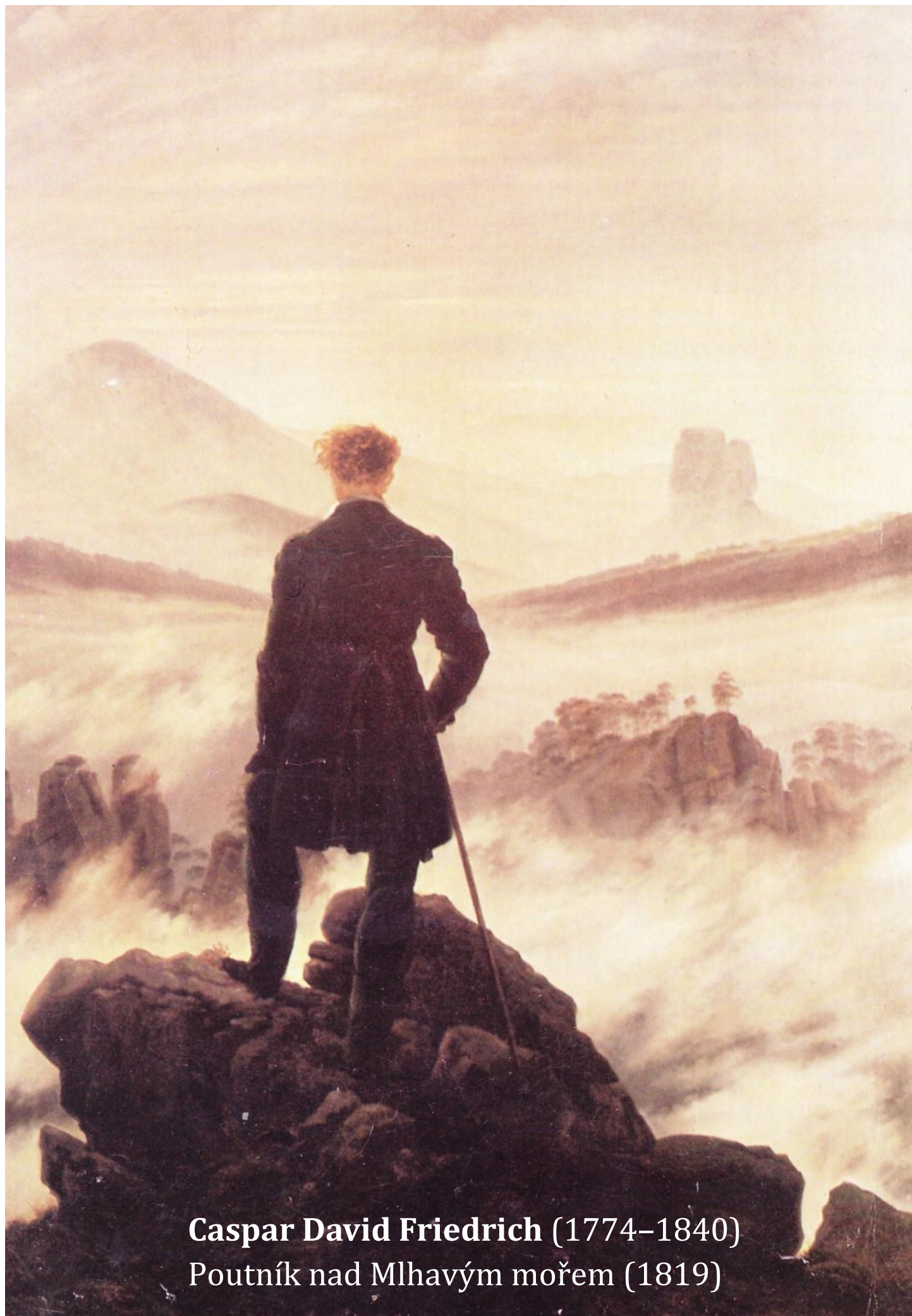
Caspar David Friedrich (1774–1840) Poutník nad Mlhavým mořem (1819)