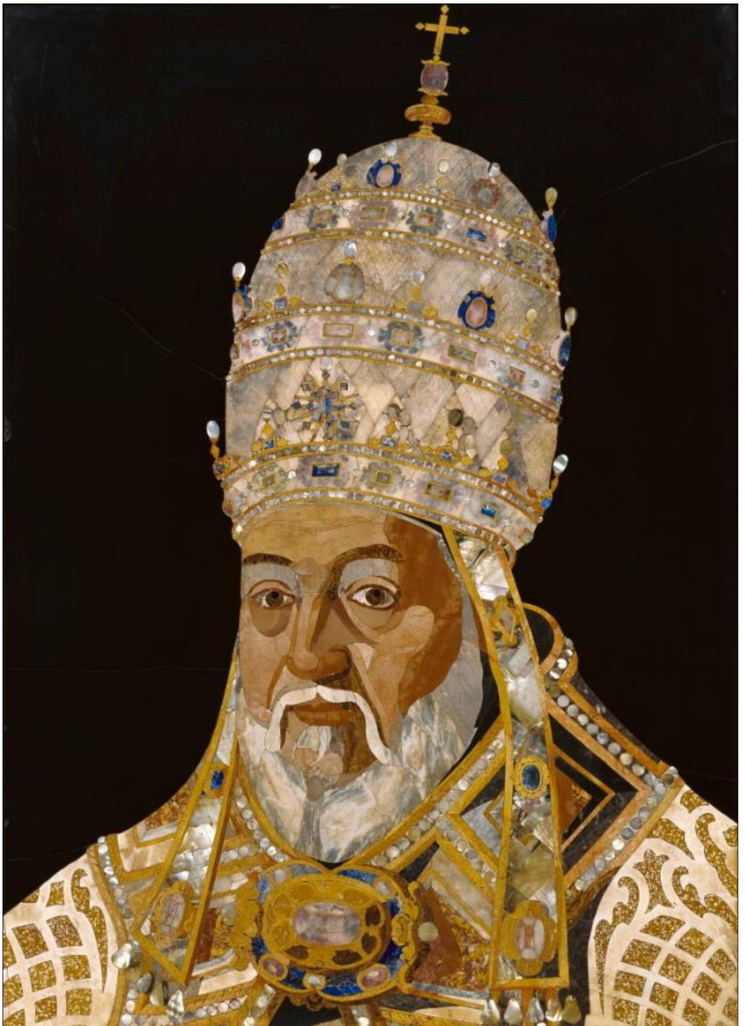
Papež Klement VIII. se narodil na den sv. Matěje 24. 2. 1536 ve Fano v Itálii jako Ippolito Aldobrandini. 30. 1. 1592 byl zvolen 231. papežem. Umírá 3. 3. 1605.