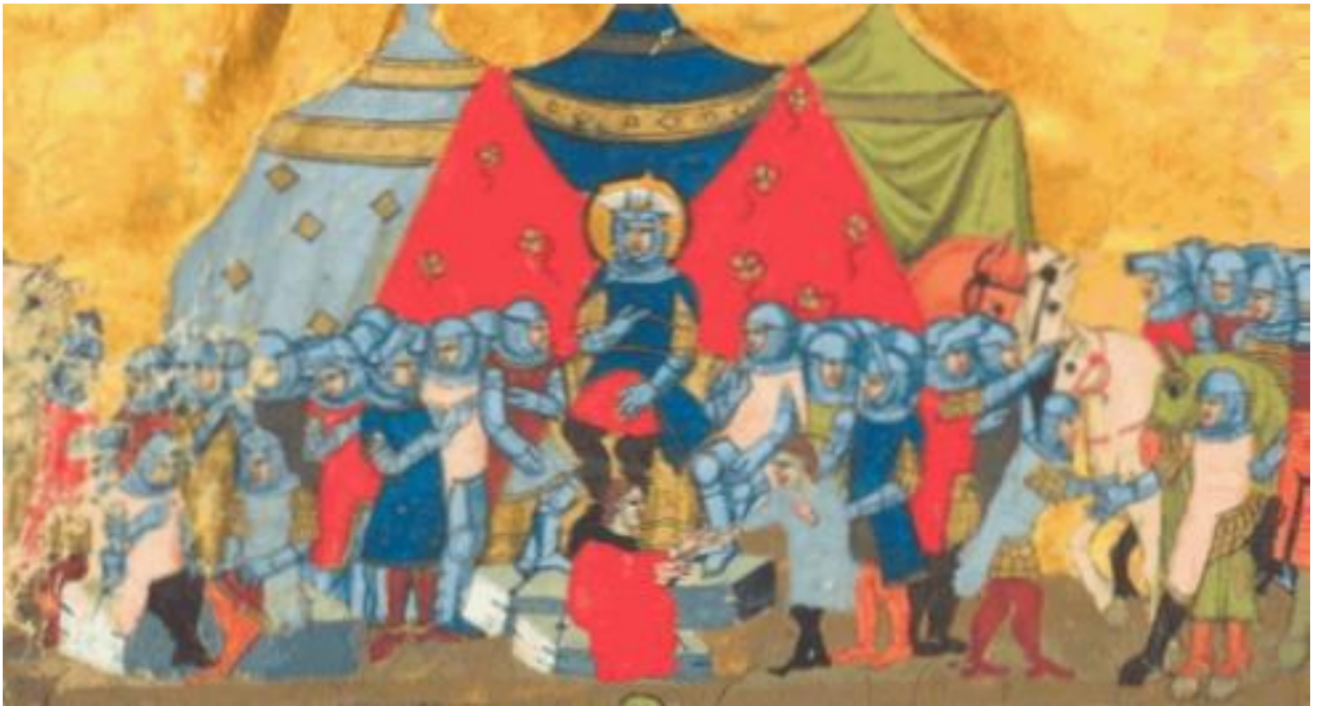
↳ Setkání knížete Václava s kouřimským knížetem Radslavem †

povraždění, ženy a děti prodány do otroctví. Ruiny města spáleného na popel celá desetiletí zarůstaly plevem a bodláčím. Jenom na dně přístavu trpělivě čekal kov – slitina ze všech soch a nádobí, kování, mincí, zbraní či okovů – které se v době požáru změnilo v potůčky rozžhaveného kovu. Už ve starověku se tato slitina, které se říkalo „ korintská měď “ stala vzácnou, nad zlato ceněnou surovinou. 1024 let poté, co ztuhnula korintská měď , zažívalo libické hradiště vskutku dějinnou událost. Český kníže Bořivoj se spolu se svojí ženou Ludmilou nechal pokřtít od velkomoravského biskupa Metoděje . Psal se rok 871 a kněžna Ludmila obdržela při té příležitosti kovový, z korintské mědi vyrobený obrázek Panny Marie s malým