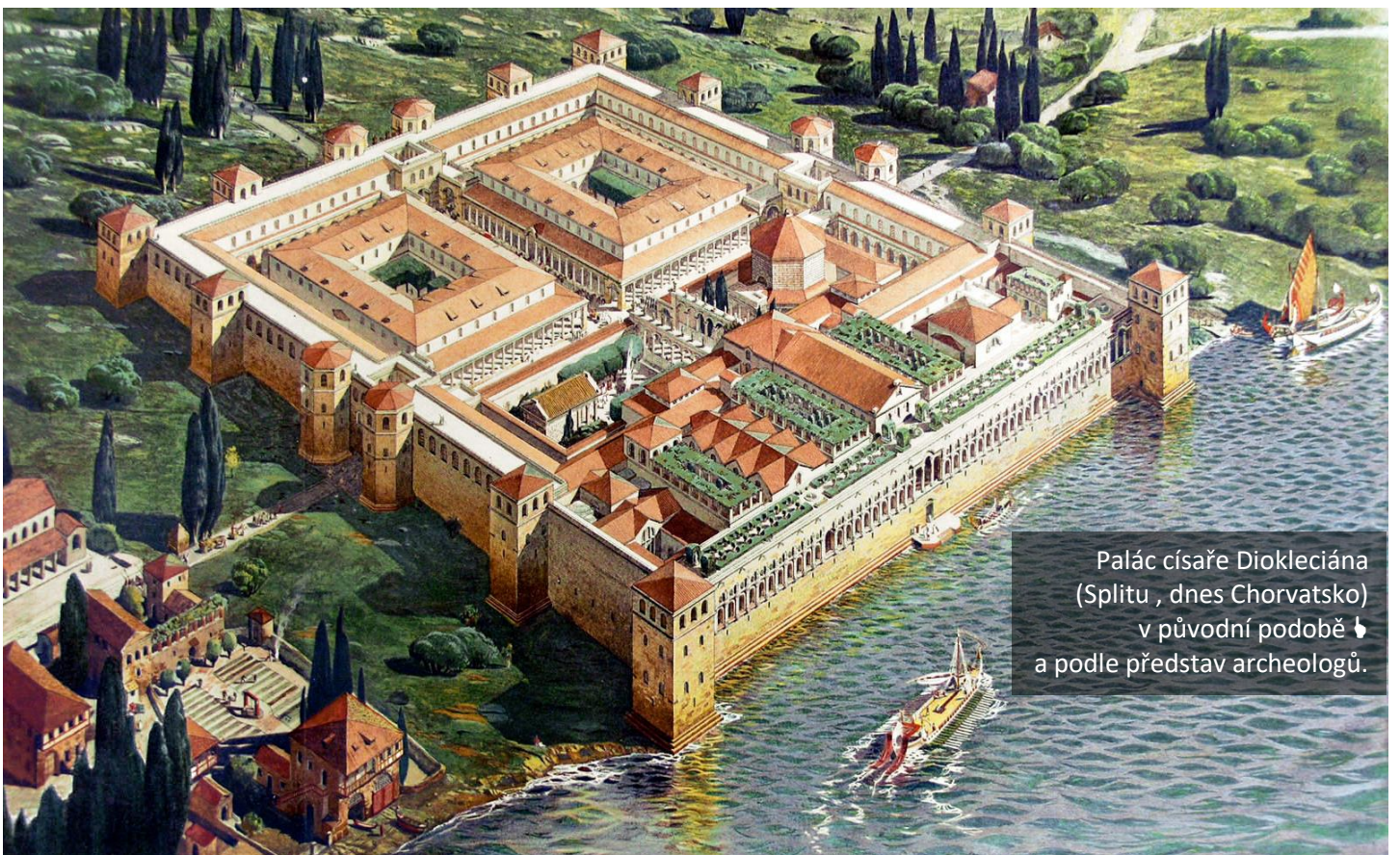
Palác císaře Diokleciána (Splitu , dnes Chorvatsko) v původní podobě a podle představ archeologů.

Císař Dioklecián se, žel bohu, neproslavil svými velkolepými stavbami, jak by dozajista rád, nýbrž fanatickou nenávisť ke křesťanům, které pronásledoval, mučil a trýznil, jak jen to šlo. Naprostého státnického nonsensu se z lidského i historického úhlu pohledu dopustil kolem roku 307 . Krátce před tím se totiž dle legend do Říma dostal učitel Modestus , kojná Crescencie [Krescencie] a jejich svěřenec Vít . Vít byl tehdy ve věku, kdy naše děti chodí na základní školu. Uvádí se, že mu bylo buď