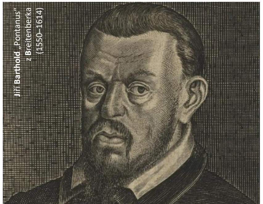
Jiří Barthold „Pontanus“ z Breitenberka (1550–1614)

Talentovaný jinoch postupně zaujal několik mecenášů, kteří jej povzbuzovali ve studiu a umožnili mu kariéru učitele. Jenže mladý pan Breitenberk projevoval jedinečné literární nadání a také rozený takt. Nakonec se mu dostalo vzdělání na krátce před tím otevřené jezuitské koleji v Klementinu . Ač Breitenberk nevstoupil do jezuitského řádu, nikdy nezapomněl na to, jak kvalitního vzdělání se mu u Tovaryšstva Ježíšova dostalo. Jeho učitelem byl např. slavný světec Edmund Kampián , který byl krátce poté, co jej viděl Pontanus naposledy, popraven ve své rodné Anglii za hlásání katolické víry. Ani anglická královna Viktorie nebyla šťastná,