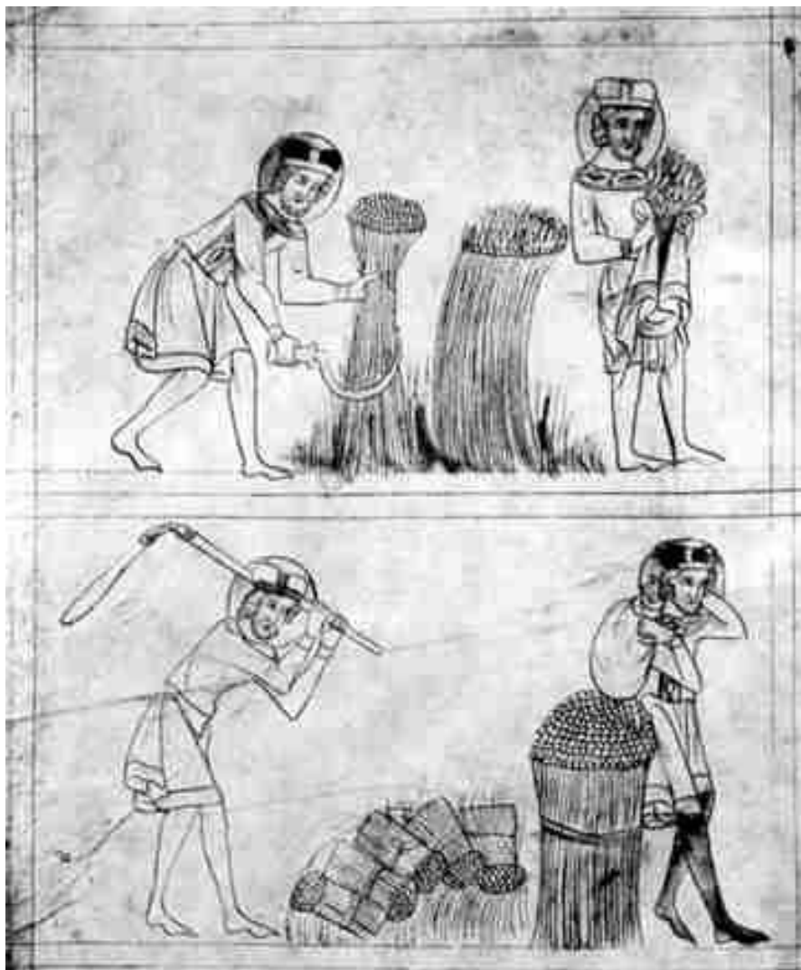
Svatý Václav a jeho věrný sluha Podiven .

pravděpodobně i podepsalo na Boleslavově rozhodnutí zbavit se svého knížecího bratra. Jenže tou skutečnou příčinou mohlo být posílené sebevědomí – vždyť se mu právě toho dne – a mohlo to být ještě před vraždou čili časně zrána – narodil po Boleslavovi II. další syn jenž do dějin vstoupil pod jménem Strachvas . Zpráva o narození syna musela mít pro Boleslava naprosto zásadní význam a vyvolat v něm celou symfonii emocí. Vedle hrdosti na otcovství a spokojenosti, že mu Bůh dozajista přeje, musel Boleslav přemítat i reakci knížete Václava na tuto novinu. Bylo v duchu oněch časů zvaných „temné století“, že se potenciální uzurpátoři trůnu vyvražďovali. Boj o moc nad celou zemí byl často krutý a na vládnoucí trůn či stolec málokdy usedlo více osob než jedna. A pokud se tak stalo – jako tomu bylo v případech regentství za nezletilé následníky – věci často nabíraly nečekaný a tragický spád. Svatá Ludmila by mohla vyprávět. Proto to mohly být tyto obavy, které vedly Boleslava k prudké reakci a bratrovraždě.