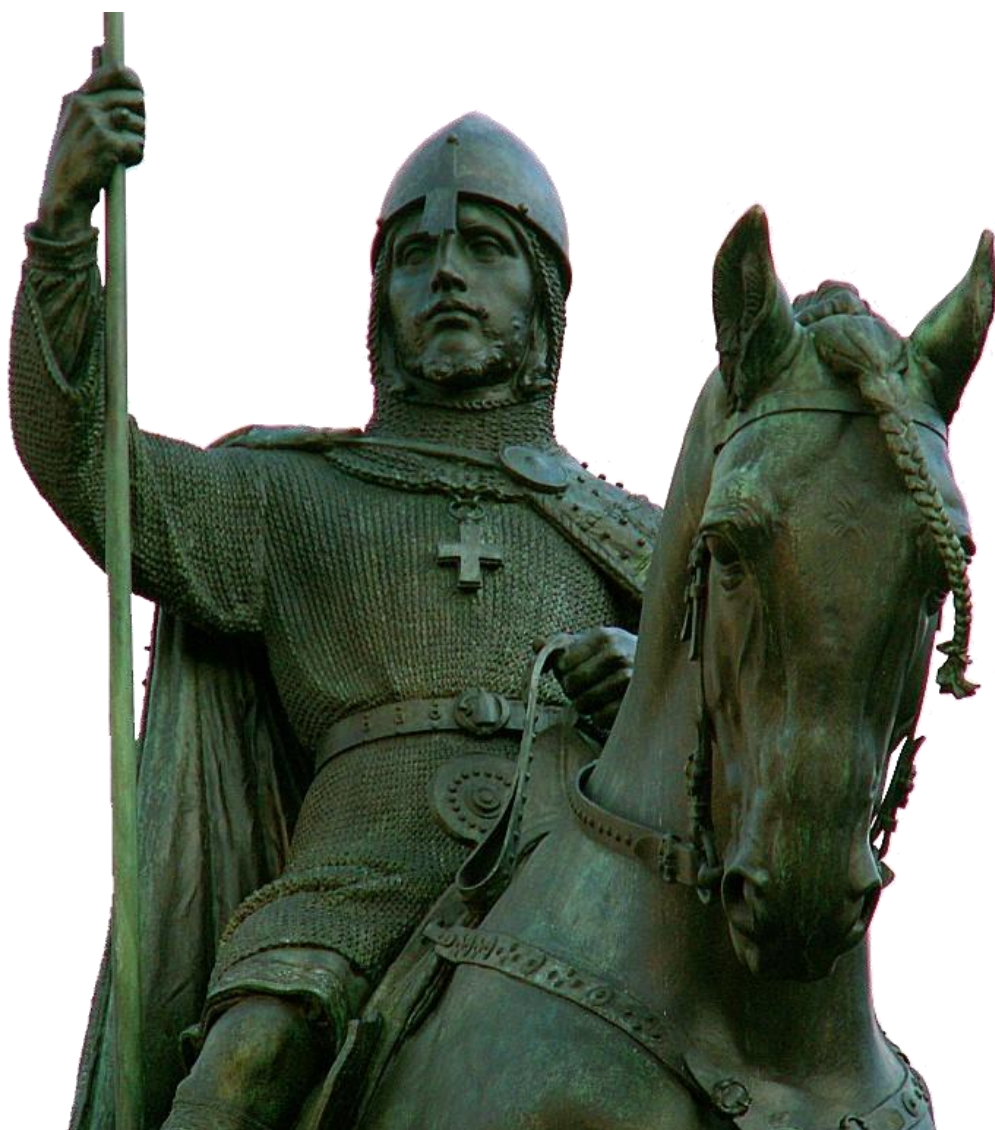
Svatý Václav hlavní patron české země

Christianizace Čech i snaha o jejich podmanění stavbou rotundy sv. Víta neskončila. Zato životní úděl nejpřednější českého světce se pomalu chýlil ke svému dramatickému konci. Tragicky vyvrcholený spor mezi Václavovou matkou Drahomírou ze Stodor , jež byla saského původu, a babičkou Ludmilou , nenechal stranou ani dalšího člena Přemyslovské rodiny – budoucího knížete Boleslav I. Ten v dětství vyrůstal společně se svým bratrem na hradišti v Budči . Dostalo se mu tudíž jak skvělého vzdělání, tak i vzhledu do významu křesťanství pro prestiž a budoucnost celého knížectví. Po smrti Ludmily a bratrova nástupu na knížecí stolec to byl právě Boleslav , kdo se stal útočištěm pro svoji pohanskou matku Drahomíru . A jak ubíhaly roky, mezi sourozenci rostly i rozdíly v přístupu ke správě knížectví. Není pravděpodobné, že by Stodoranka Drahomíra radikálně změnila postoj ve věci přístupu k německým sousedům, a tak je nanejvýš pravděpodobné, že ve svém druhém synovi viděla lepšího vládce než v Ludmilině oblíbenci Václavovi . Vždyť ten se uvolil platit ohromné výkupné Bavorům , kteří se mu odvděčili pouhým kusem kosti.