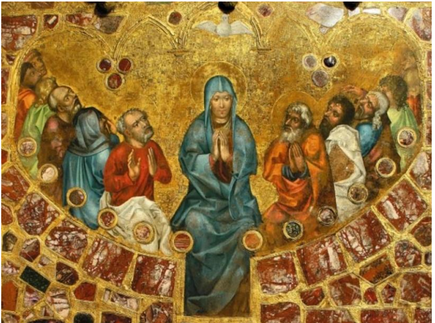
Freska sv. Ludmily z katedrály sv. Víta

Ježíškem v náručí. Pravděpodobně se jednalo o osobní dar doplňující předání vzácného bohoslužebného nádobí z téhož materiálu. Legendy se o této události v jednotlivých detailech rozcházejí, ale jejich gró zůstává stejné: Ludmila obdržela vzácný dar – budoucí Palladium země české . Poté, co se na Tetínském hradišti odehrála její vražda, Palladium zdědil její vnuk – kníže Václav . Dle legend jej nosil stále u sebe a roku 922 je měl zavěšené na krku, když mělo dojít k legendární bitvě u Kouřimi . V ní se střetl s odbojným knížetem Radslavem , vůdcem zlického lidu. Legendy popisují zázrak, který se toho dne na bojišti udál. V momentě, kdy se už schylovalo k bitvě, zaleskl se kříž na Václavově helmici a zraku Radslavově nezůstalo skryto ani Palladium , které měl kníže zavěšené na krku. To byly jasné atributy spojenectví Václava s dalšími křesťanskými panovníky a Přemyslovcovo vyvolení od Boha. Zlický kníže si v ten okamžik mohl snadno spočítat, že je rozumné upustit od války s křesťanským knížetem a vyhnout se tak tomu, aby on sám byl označen