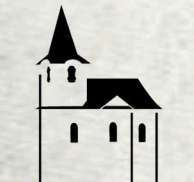
kostel sv. Matěje